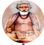
कामेश्वरानन्द नाथ / कामेश्वर्यम्बा